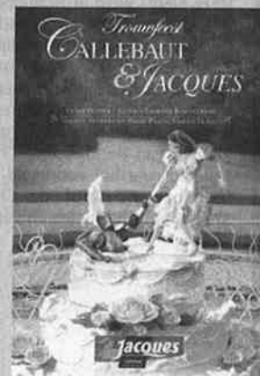
De uitnodiging voor het chocoladen trouwfeest. Kos

klassiek. Bij ons gaat het om leuke reclame waar iedereen over spreekt, zonder dat het handenvol geld kost.»